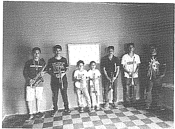
Escala de Si bemol mayor Actividad realizada el 06 de julio de 2018