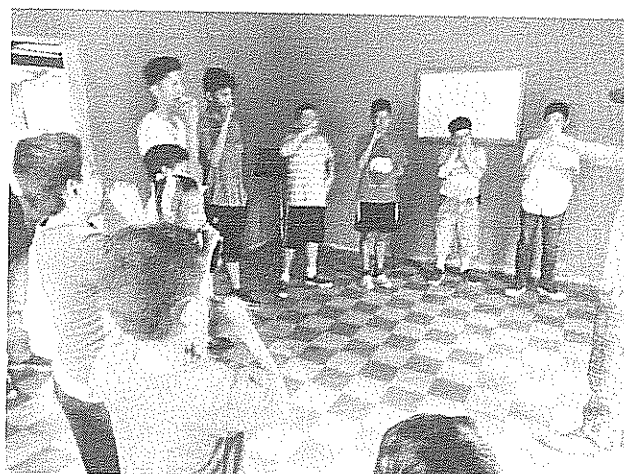
Escala de La bemol mayor Actividad realizada el 23 de julio de 2018