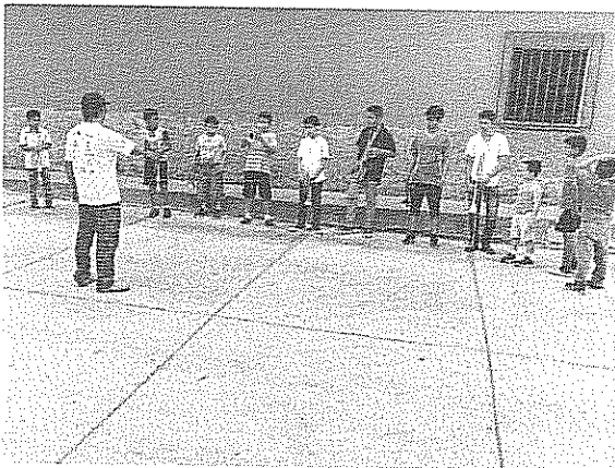
Arpeggio de Si bemol Actividad realizada el 10 de julio de 2018