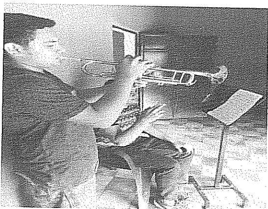
Arpeggio de Mi bemol mayor Actividad realizada el 19 de julio de 2018