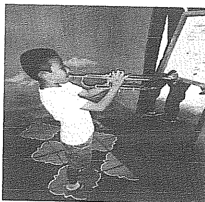
Escala de Mi bemol mayor Actividad realizada el 16 de julio de 2018